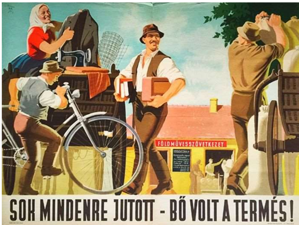
A téészeket hirdető propagandaplakát