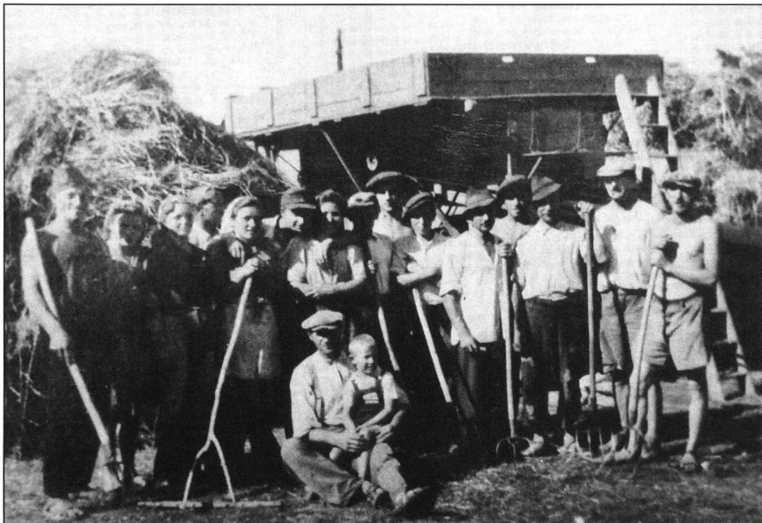
Cséplőbrigád az 1950-es évek elején