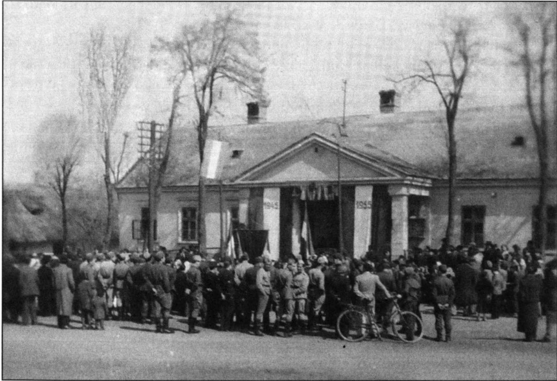
Kivezényelt katonák Bodajkon 1955. április 4-én