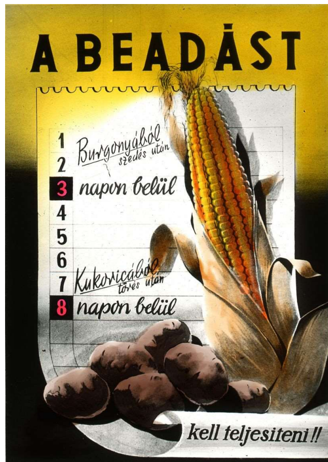
A beadást hirdető propagandaplakát