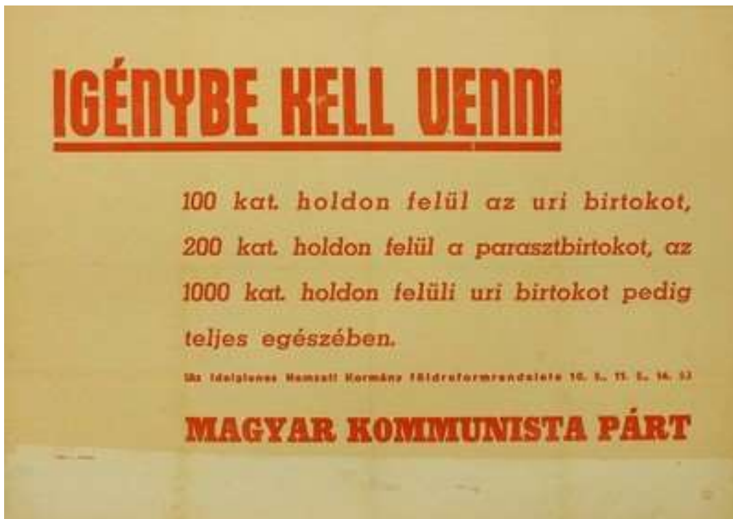
Az MKP röplapja a földreformról